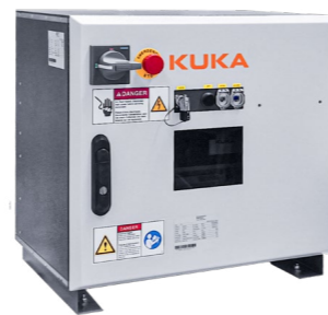
Das KR C5 micro cabinet ist die fertige Steuerungsschranklösung in Schutzart IP54 für den Betrieb von KUKA Kleinrobotern und bietet optional auch Platz für kompakte Zusatzantriebe und weiterführende Peripheriefunktionen.

Kleiner, flexibler, smarter. Kompromisslos als offene und flexible Plattform entwickelt, repräsentiert die KR C5 micro den nächsten Quantensprung in der Robotersteuerung. So ist die Steuerung nicht nur in der Lage, sich nahtlos in bestehende Automationslandschaften zu integrieren, sondern kann darüber hinaus als »Functional Twin« auch KR C4 Applikationen einfach übernehmen.