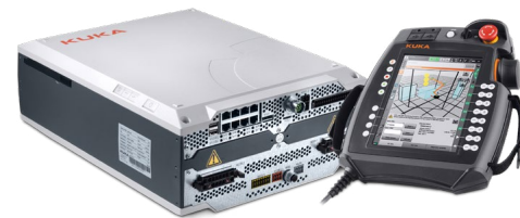
Mit der neuen Kleinrobotersteuerung KR C5 micro hebt KUKA die automatisierte Produktion auf ein neues Level: langlebig und zukunftssicher.

Der KR DELTA beeindruckt mit Geschwindigkeit, Präzision, Reichweite, Verlässlichkeit, Vielseitigkeit – und mit seinem geringen Platzbedarf. Dieser Parallelarmroboter wurde für Pick-and-Place-Aufgaben geschaffen, bei denen kurze Zykluszeiten und das schnelle Erkennen und Handhaben von Objekten im Zentrum stehen. Mit einer Traglast von drei Kilogramm eignet er sich hervorragend für das Automatisieren von Kommissionierungs- und Verpackungsaufgaben – zum Beispiel in der Elektronikindustrie. Eine besondere Stärke aller Roboter der KR DELTA Serie liegt im geringen Wartungsaufwand. Die Kugelgelenke sind selbstschmierend und auch beim Reduziergetriebe ist über den gesamten Lebenszyklus kein Austausch des Schmiermittels notwendig.